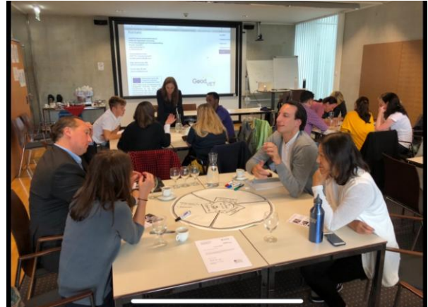
Abbildung 3 Abschlussveranstaltung Innsbruck 14.10.2019

Im Rahmen dieser vier Veranstaltungen wurden die Indikatoren, die daraus resultierende Handreichung, die Best-Practice Beispiele und das Online basierte Analysetool erfolgreich vorgestellt.