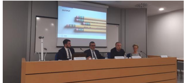
Abbildung 4 Abschlussveranstaltung Bergamo 17.10.2019

Innerhalb der durchgeführten Veranstaltungen wurde der Austausch und der Dialog zwischen Akteuren bzw. Zielgruppen und Projektverantwortlichen gefördert. Die Teilnehmenden hatten hier die Möglichkeit mehr über das Projekt und die Indikatoren zu erfahren und konnten so ihr eigenes Vorgehen bei der Durchführung von Maßnahmen zur Integration von Geflüchteten durch berufliche Bildung analysieren und auf Basis der Forschungsergebnisse nachhaltig verbessern.