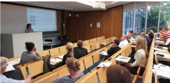
Abbildung 2 Abschlussveranstaltung Köln 02.09.2019

Außerdem hat zum Projektabschluss in jedem der vier Partnerländer eine Multiplikatorenveranstaltung mit interessierten Akteuren aus Politik und Praxis stattgefunden.